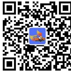
全国 3D 大赛微信公众号

全国三维数字化创新设计大赛组委会 国家制造业信息化培训中心 全国 3D 技术推广服务与教育培训联盟(3D 动力) 光华设计发展基金会 2024 年 3 月